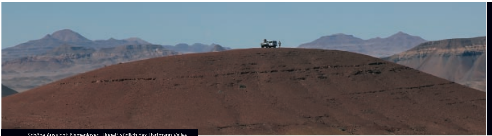
Schöne Aussicht: Namenloser „Hügel“ südlich des Hartmann Valley.

Die Nähe zur Namibwüste spiegelt sich in der kargen Landschaft wider. Weite, fast vegetationslose Ebenen, nur manchmal unterbrochen von rotbraunen Inselbergen, ziehen sich bis zu den schroffen Bergketten. Nach seltenen Regenfällen verwandeln sich diese Flächen in grüne Gärten. Dann wagen sich neben Springböcken auch Oryxantilopen aus den Trockenflusstälern heraus, um zu äsen. Auf dem Weg nach Norden unterbricht nur das Rattern des Autos auf der Wellblechpiste die Monotonie der grandiosen Wüstenlandschaft. Am Ende versperrt ein gewaltiger Dünenrücken die Weiterfahrt. Über eine steile Sanddüne rutschen wir zum Kunene hinunter. Springböcke nagen an der kargen Vegetation. Ein großer, schwarzer Geier kreist über den Besuchern. Dort, direkt am Kunene, liegt das absolute Übernachtungs-Highlight der Tour: Serra Cafema, eine